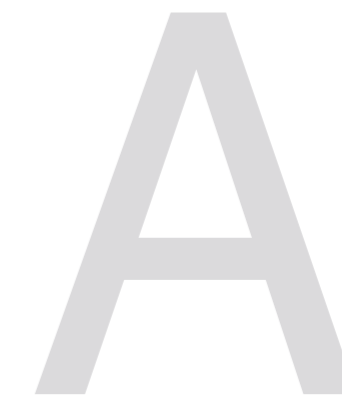
Seite 2 (Rückseite innen)